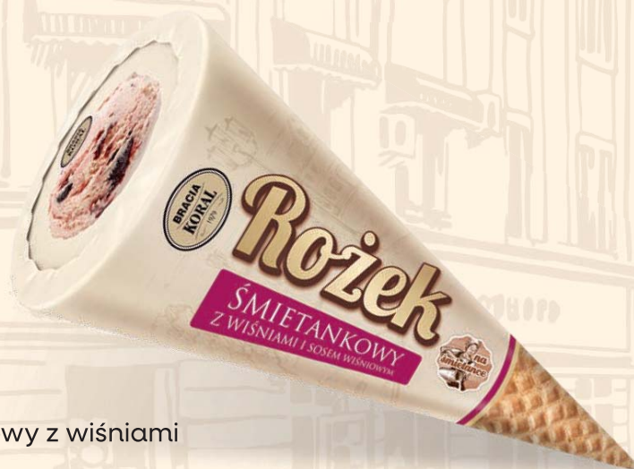
śmietankowy z wiśniami