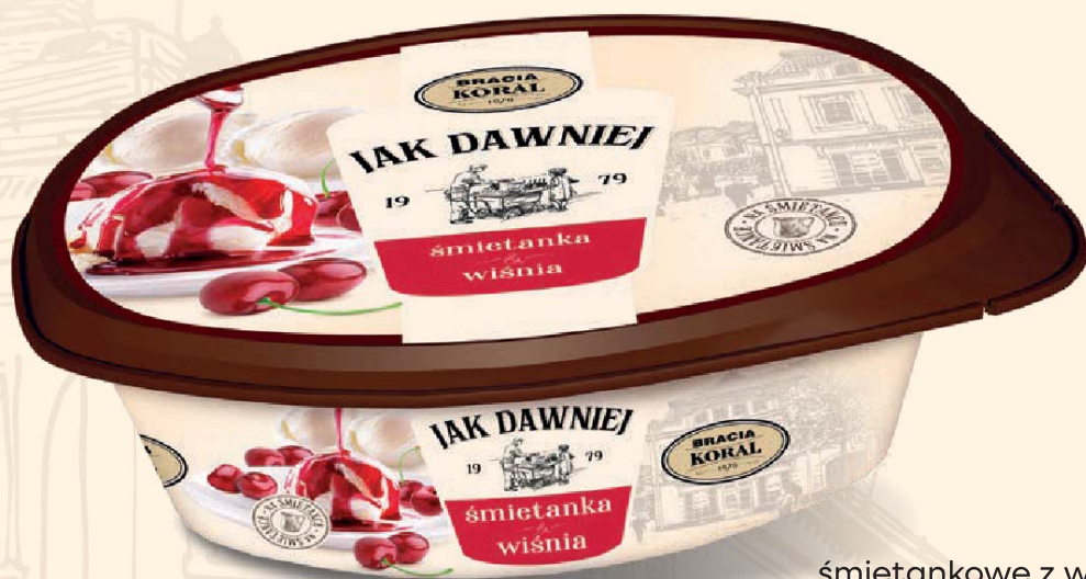
śmietankowe z wiśniami i sosem wiśniowym