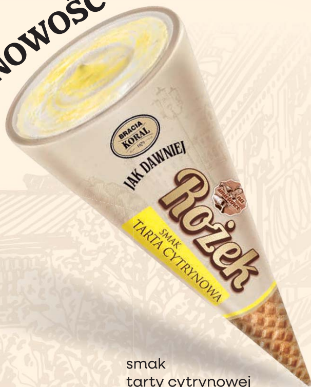
smak tarty cytrynowej