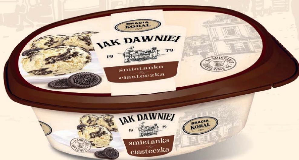
śmietankowe z ciasteczkami