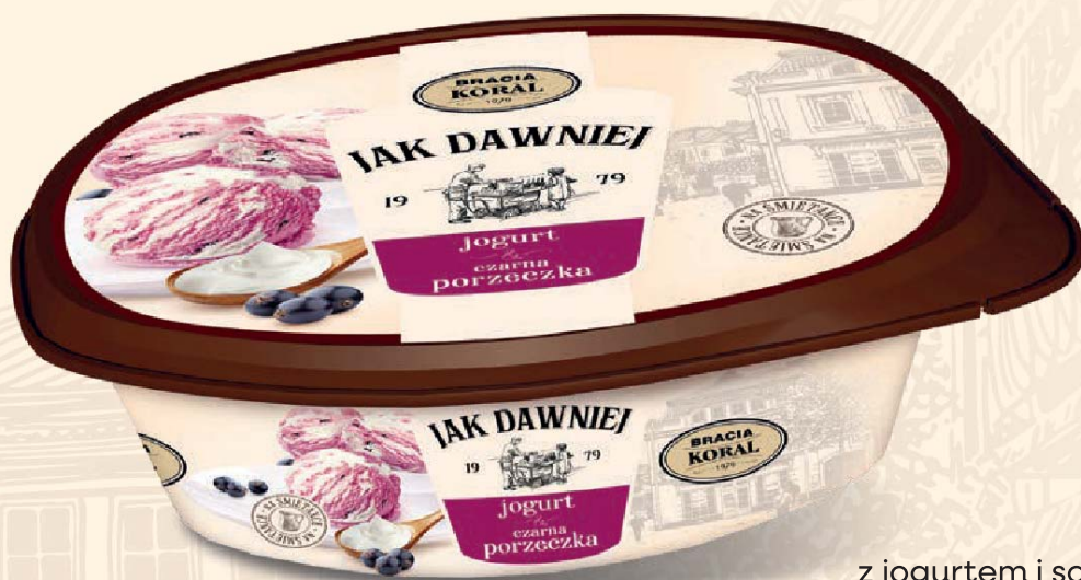
z jogurtem i sorbet z czarnej porzeczki