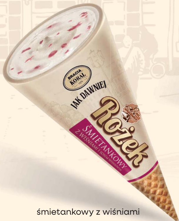
śmietankowy z wiśniami