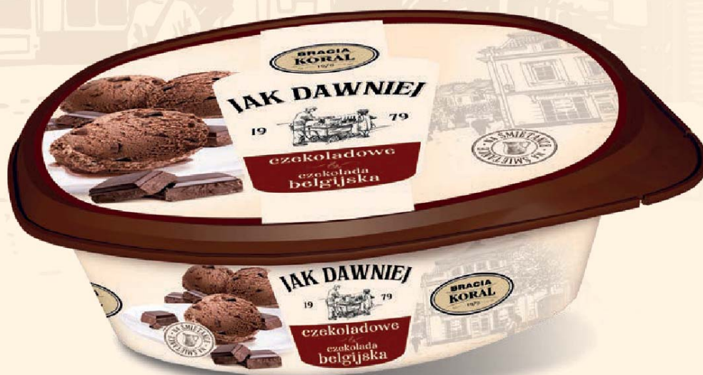
czekoladowe z czekoladą belgijską